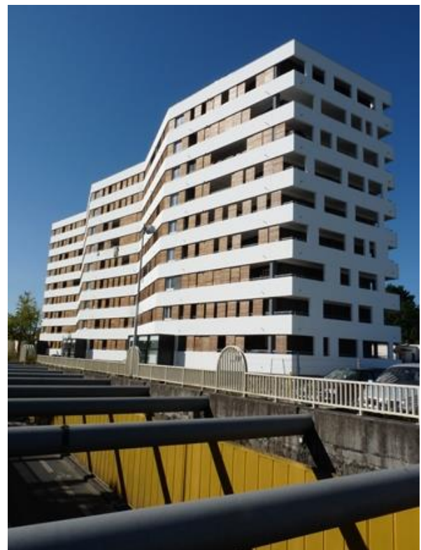
Le même bâtiment, une fois réhabilité