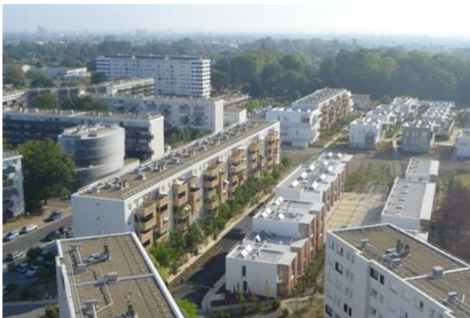
Arago aujourd'hui, après 5 ans de travaux.

Après avoir été primé en 2015 pour ses performances énergétiques par GrDF et l'Union Sociale pour l'Habitat, Arago est en cours de labellisation EcoQuartier par le Ministère du Logement et de l'Habitat durable.