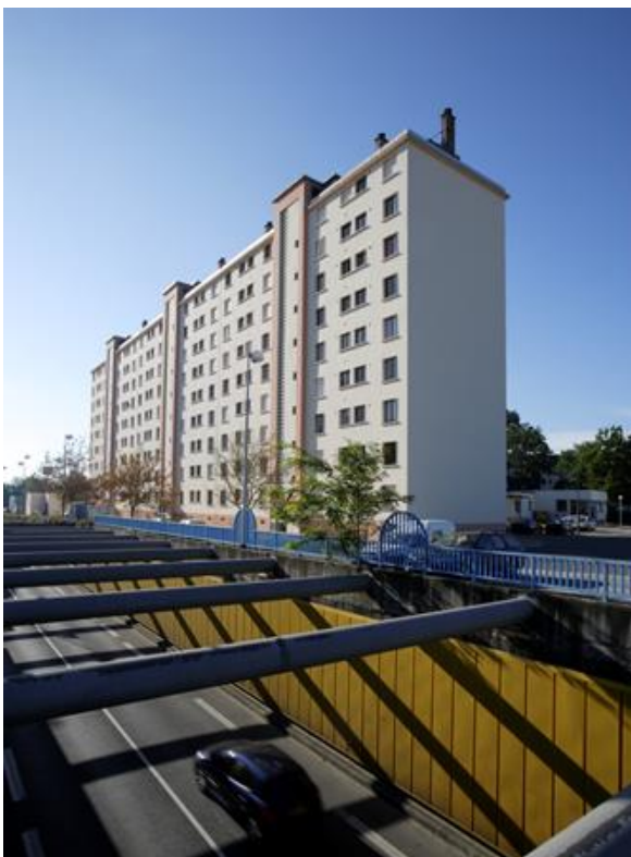
Un des 12 bâtiments avant la rénovation