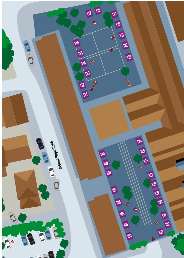
ÉCOLE ARISTIDE BRIAND