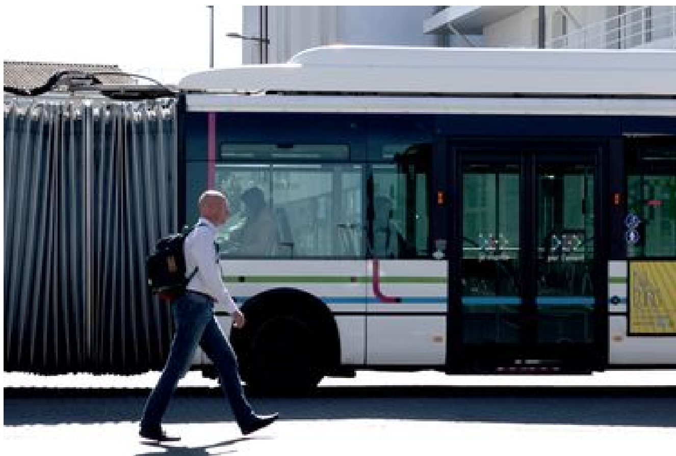
Bus & tramway