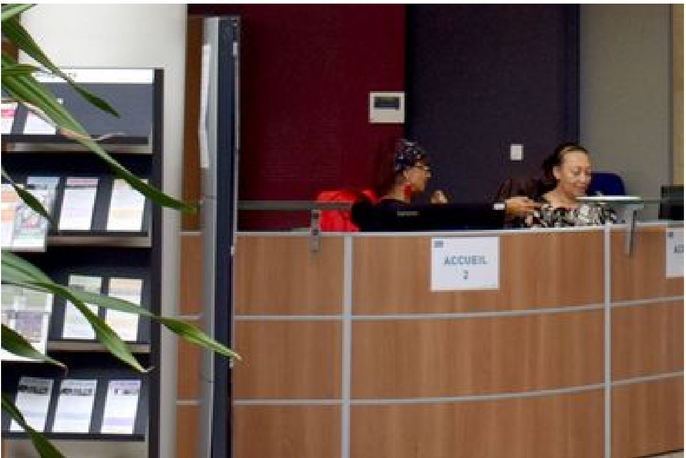
Annuaire des services de la ville