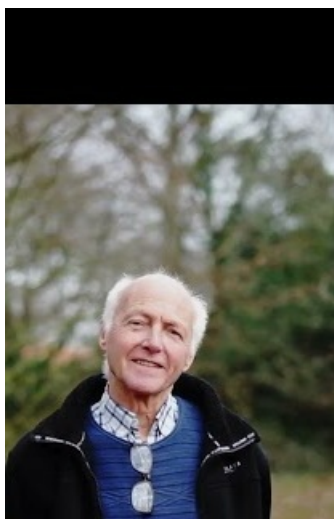
maies de la Cité des Castors

Découvrez les vidéos de présentation des 9 projets lauréats du budget participatif 2021.